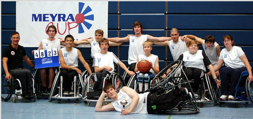
Sieger des Jugend MEYRACUP in Wetzlar: Die Mainhatten Skywheelers Youngsters.

Nachdem im Vorjahr erstmals die größte europäische Breitensport Turnierserie MEYRACUP unter der Leitung von Günther Vogel mit einem Jugendturnier in Frankfurt/Main neue Wege ging, feierte diese Idee in diesem Jahr nur 70 Kilometer nördlich in Wetzlar ihre Fortsetzung. Im Endspiel triumphierten dabei erneut die Youngsters der Mainhatten Skywheelers, die den Junior-Bears Essen beim 48:23 keine Chance ließen. Platz drei ging an Gastgeber RSV Lahn-Dill, der im Spiel um Platz drei den PSC Pforzheim bezwang. Mehr zum MEYRACUP unter www.meyra-cup.de .