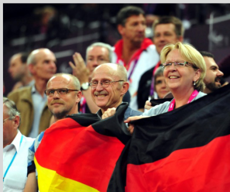
Links: Zwei von 17.000 Fans in der North Greenwich Arena; rechts das Trio Thomas Schaaf, Willi Lemke und Hannelore Kraft (v.l.) freut sich über den deutschen TRIumph.