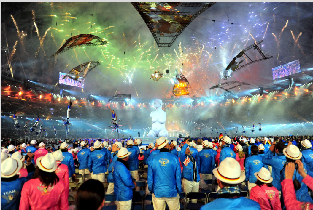
Eröffnungs- und Schlussfeier waren ein Genuss für alle Sinne.

Und ihre Untertanen nahmen die in ihr Herz auf. Egal ob im riesigen Rund des Olympic Stadium, im stimmungsgewaltigen Velodrom oder dem einzigartigen Aquatic Center, egal ob Wochenende oder Werktag, ausverkauften Arenen wohin man nur blickte. 2,7 Millionen Besucher sind auch in dieser Kategorie ein neuer Rekord.