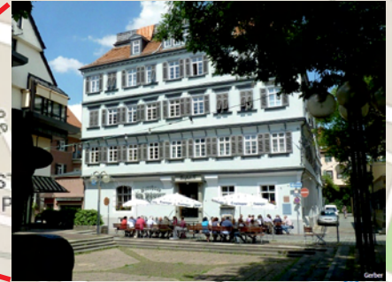
Technische Sitzung Freitag Abend 13.03.2015 Gasthaus Schwanen