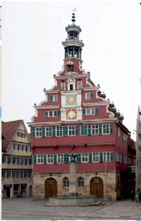
Abendveranstaltung Bürgersaal Altes Rathaus