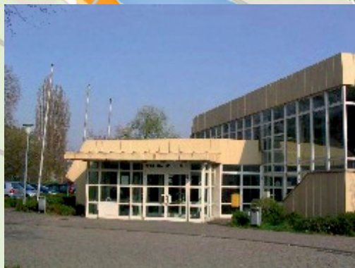
Neckarsporthalle Dammstrasse 1